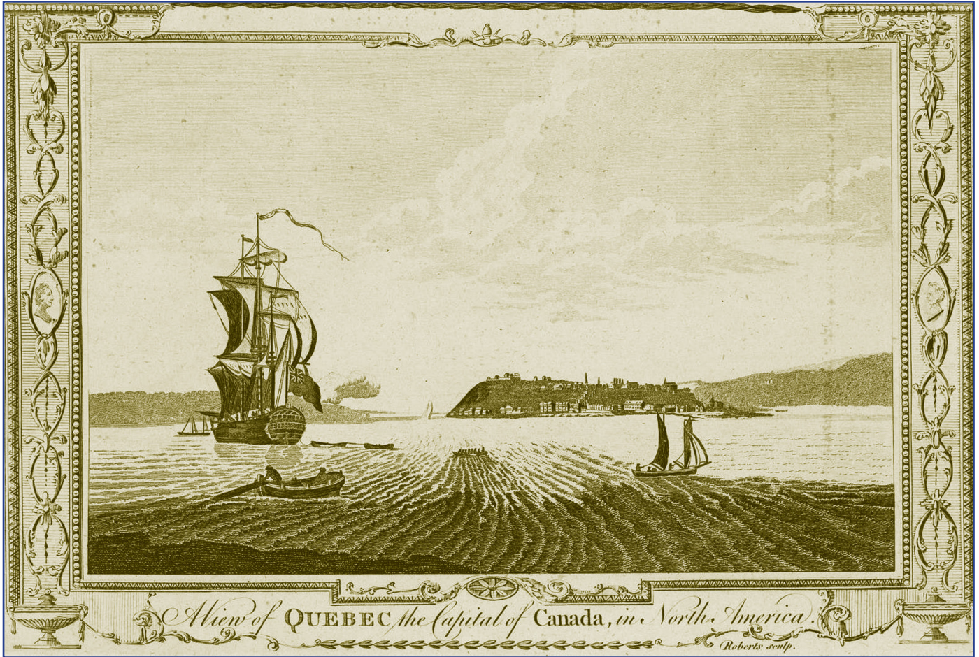
A view of Quebec the capital of Canada, in North America